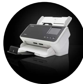
Escáneres S2060w/S2080w Kodak