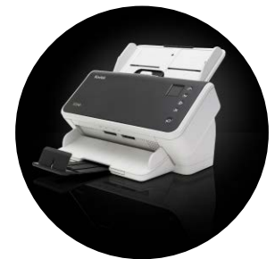
Escáneres S2040/S2050/S2070 Kodak